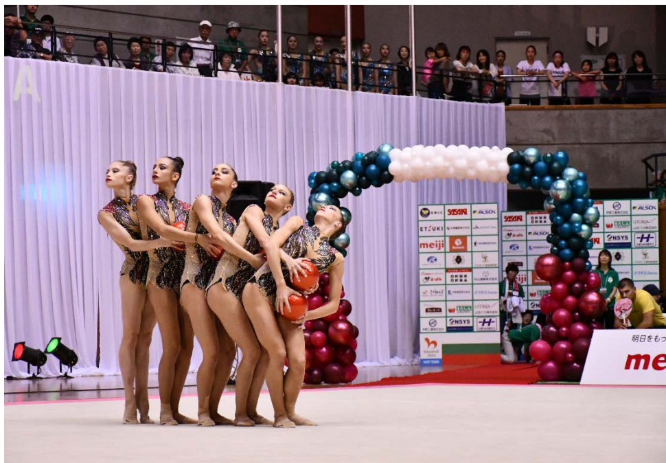
(山形県村山市でのブルガリア新体操公開演技会 2019年7月)