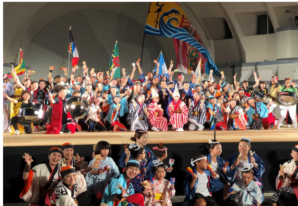
(「原宿表参道元氣祭り・スーパーよさこい2019」でのスチールパンで奏でる正調踊り 2019年8月)